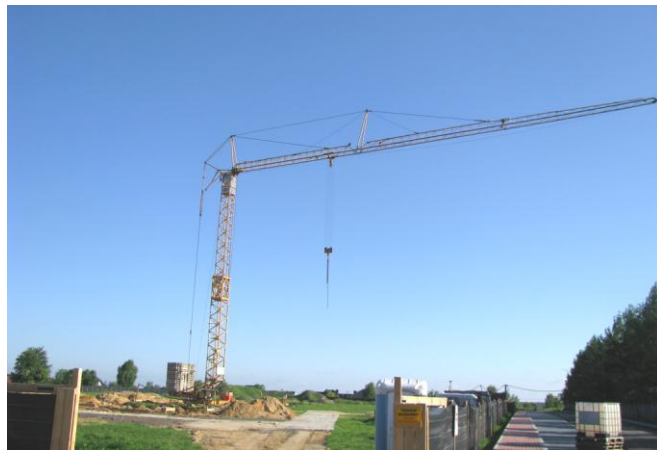
Budowa Przedszkola we Wręcycy Wielkiej