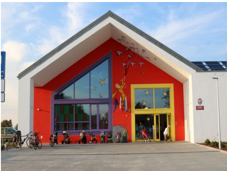
Przedszkole we Wręczyca Wielkiej

W 2018 r. oddano do użytku 6 dużych inwestycji w oświacie, w tym: