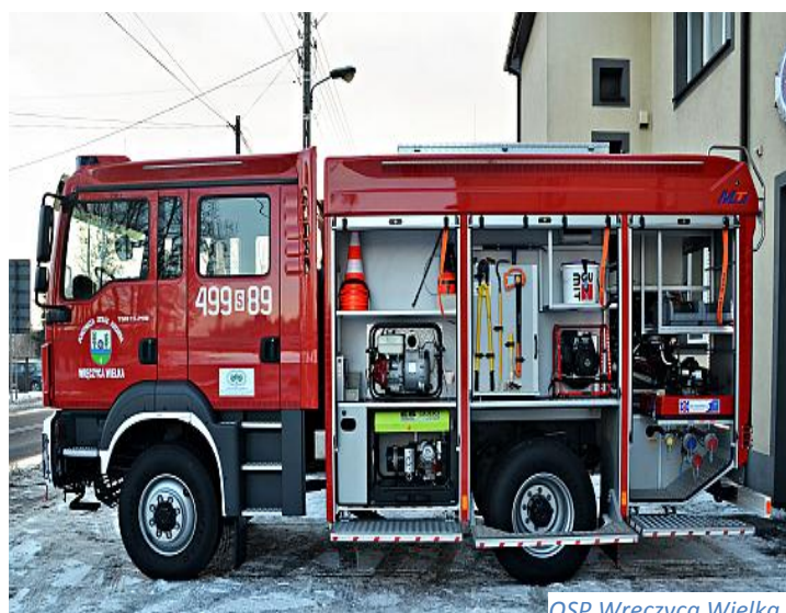
OSP Wręczyca Wielka