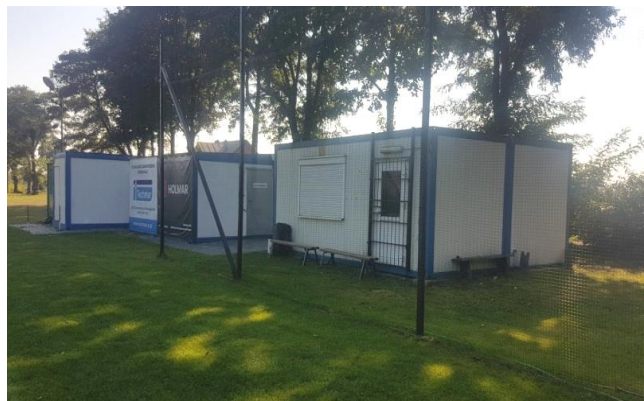
KS HURAGAN Jeziro

W gminie jest 21 placów zabaw, park rekreacji oraz 2 siłownie zewnętrzne.