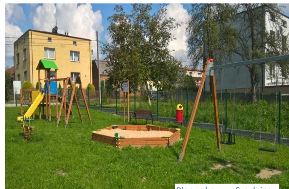
Plac zabaw w Szarlejce