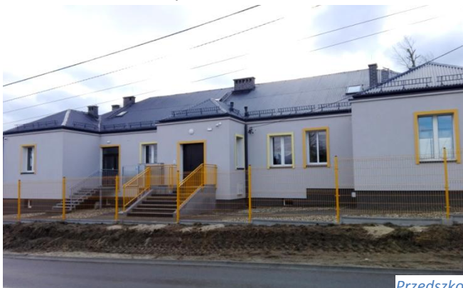
Przedszkole w Pile Pierwszej