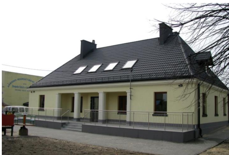
Przedszkole w Węglowicach